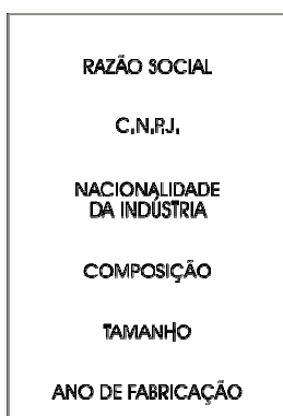
Figura1–Informações do fabricante