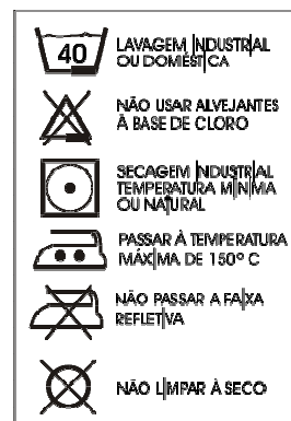
Figura 17- Conservação do tecido e da peça